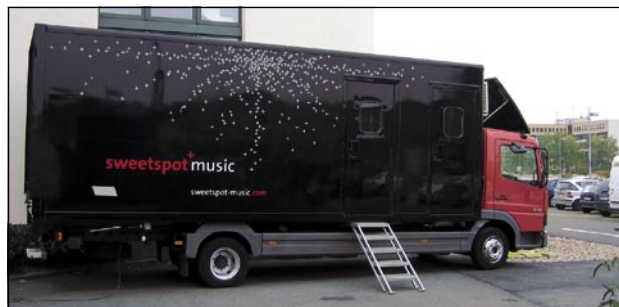
Ulf Ronnebergers Surround-Mobile

kümmert. Erst mal einen Milchkaffe, denke ich, und begegne auf dem Weg an die Kaffeetische einer ganzen Horde bekannter Gesichter. Begrüßung, freundschaftlicher Austausch, ein interessierter Blick in die Runde des Ausstellungsraums – das wird sicher sehr interessant werden. Die ersten Besucher treffen ein und mischen sich ins Geschehen. Erste Kontakte werden aufgenommen, die ‚Show‘ beginnt. Es ist nicht einfach, meine Eindrücke verbal zu vermitteln, aber das ist natürlich etwas ganz anderes als eine AES oder Tonmeistertagung. Ich habe kaum Zeit, richtig darüber nachzudenken, aber die auf höchster Ebene produzierenden Kollegen brauchen eine Plattform wie diese, einen Treffpunkt des Erfahrungsaustauschs auf Augenhöhe, frei vom ‚Ballast‘ unendlich vieler Themen, die zwar alle ihre Daseinsberechtigung haben, jedoch vom Kernthema dieses speziellen Interessenkreises ablenken. Wenn ich konsequent rechne, zähle ich knapp unter 20 Aussteller, die es mit durch Marken definierte ‚Unterabteilungen‘ auf eine Zahl von etwas über 30 bringen – dazu vier hochkarätig besetzte Audio-Suiten, die wie kleine Tonregien komplett ausgestattet sind, ein bisschen Media, ein bisschen Ausbildung und der